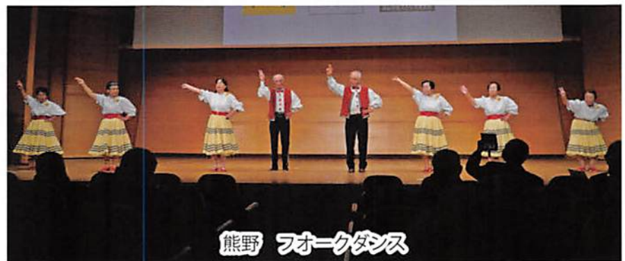
熊野 フォークダンス