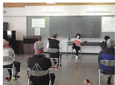
楽しく体を動かせました