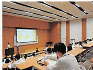
— 学びの風景 —

この2学部は地域社会存続の必須の要素を表しています。地域社会は人と産業によって成り立っており、そのため大学には、地域社会における子どもの発達と次世代育成に係る学問である児童教育学を教育研究する 教育学部 、産業の発展と環境と調和したまちづくりに係る学問である都市経営学を教育研究する 都市経営学部 という2つの学部が置かれています。