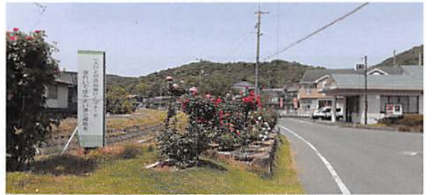
津之郷交番の前にある花壇

この絵本は、福山市の全教育施設で活用されており、平和がいつ壊れるか分からないという不安が頭をよぎる昨今、今の平和は当たり前のものではない、感謝し、守っていく努