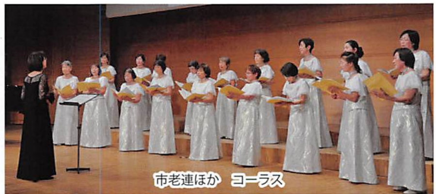
市老連ほか コーラス