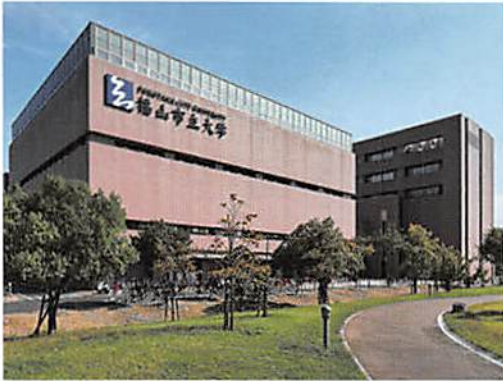
校章が見える大学外観

皆さん、わが市にある大学「福山市立大学」ってご存じですよね…。今回は、その福山市立大学の紹介です。11年前の2011年福山市港町に開学し、1学年定員1000人の教育学部と1500人の都市経営学部の2学部からなる公立大学です。(2022年学部学生数1,061名)