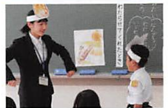
— 教育学部 —