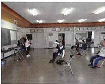
多くの男性会員が参加

と事務局で参加者を募った結果、多くの賛同者が出て、11月9日第1回目が行われました。自薦、他薦等精鋭14人の元ジャーナズ擬き？の方が午後1時半に三々五々集まり、オフィスプロ今川講師の巧みな話術に引き込まれ、笑いの渦の中で、体操を堪能されました。3回目は、11日（水）、4回目は、2月8日（水）です。まだ、いくらか空きがありますから、参加の意思のある方は、事務局まで：！