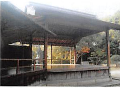
沼名前神社 能楽堂

朔学区では、地域にある沼名前神社を社会奉仕として清掃しています。今年は、11月10日に40名余りの会員が参加して清掃を行いました。