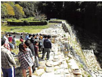
— 都市経営学部 —

「キャンパスは街、学ぶのは未来」の標語のとおり、学生は、学校や保育所、企業などを通じて市民の皆様温かく迎えられ、以下の大学の使命のもとに、地域社会の現実から積極的に学んでいます。会員のお孫さんや知り合いの方などに