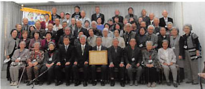
久松台学区向陽シニアクラブの方々

今回の場所は、能楽堂周辺の草取りと落葉拾いで、軽トラック3台分の成果がありました。この「能楽堂」は、豊臣秀吉が伏見城内に設けたもので、伏見城取り壊しの際に、2代