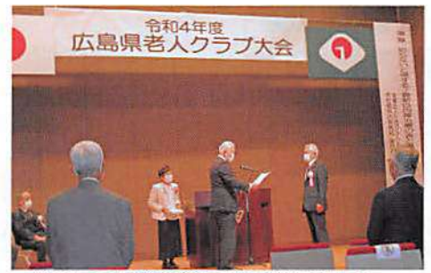
代表して古谷副会長が表彰を受ける