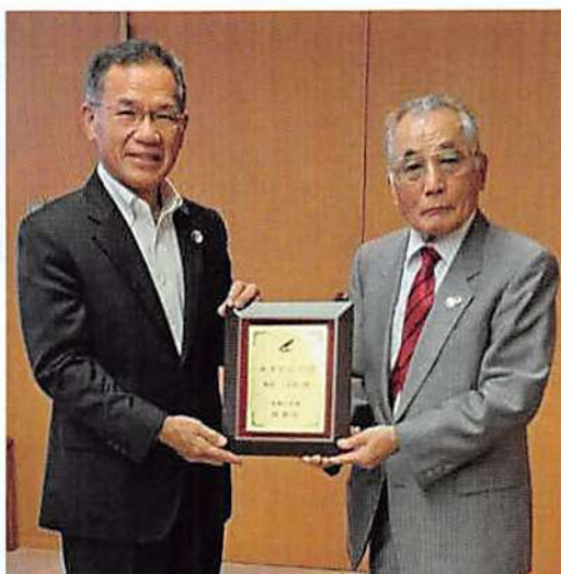
市長応接室にて、楯を受ける多田会長