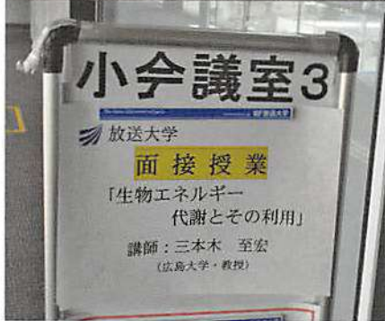
様々な講義が受けられます

放送大学の授業には、BS放送やインターネットで視聴する「放送授業」、教室で直接指導（大学教授等）を受ける「面接授業」、インターネットのみの「オンライン授業」があります。 なお、福山SSの学生の平均年齢は48・2歳で最高齢は男性が80歳、女性が84歳です。年