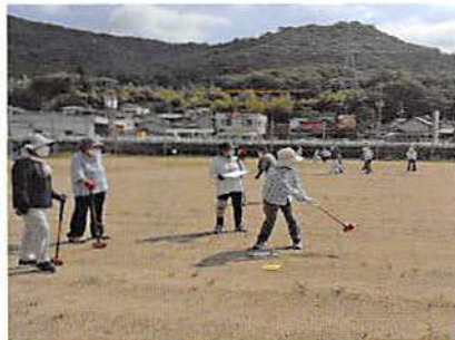
迫力あるショット

コロナで体を動かすこともままならなかった鬱憤を晴らすのごとく7月7日(木)の晴れ渡った日、千田町にある千塚池グラウンドを借りての市老連女性委員会主催のグラウンドゴルフ大会が100名