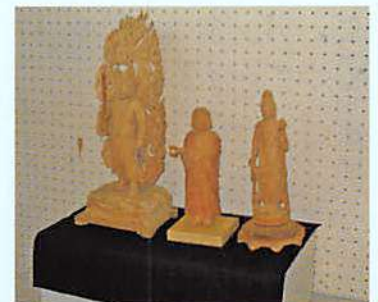
合掌!すばらしき彫り物