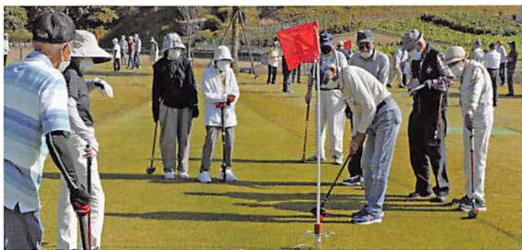
みんなが見守る中での一打

1アップル味(300ml)を参加者全員に提供していただきました。ありがとうございました。大会の結果は次のとおりとなりました。