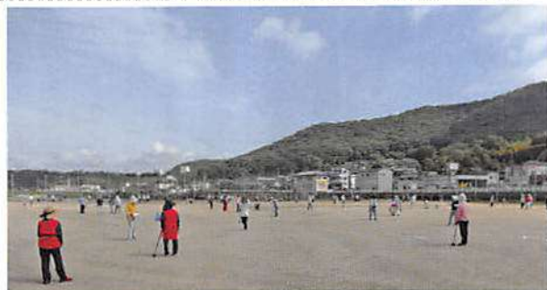
青空の中楽しめます

の参加者のもとに行われました。感染対策や熱中症対策と心配な中でしたが、皆さんの熱気とやる気で、半日の楽しい交流の時間となりました。なにせ2面も取れる広々とした会場で、6人・7人で個人戦を行いました。チームは学区混合でのメンバー編成、メンバー同士で声を掛け合いながら、2ゲームを...。ゲームの間は、藤棚の下で水分補給をしつ