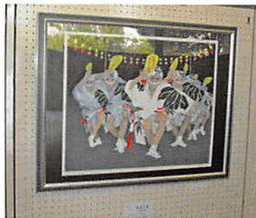
多くの人を魅了した版画