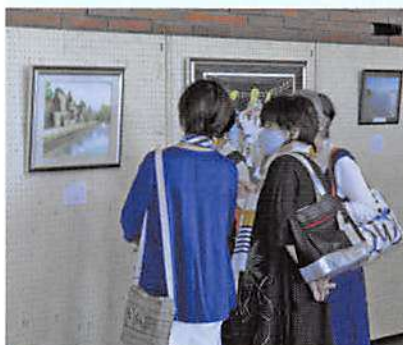
作品展で魅了されるお客さん