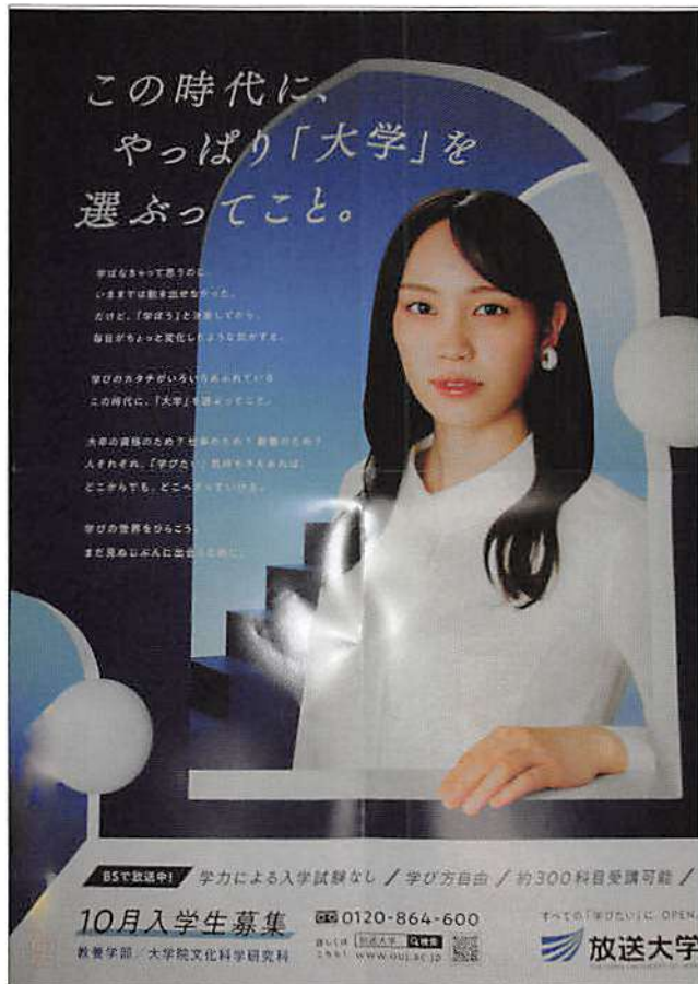
放送大学ポスター