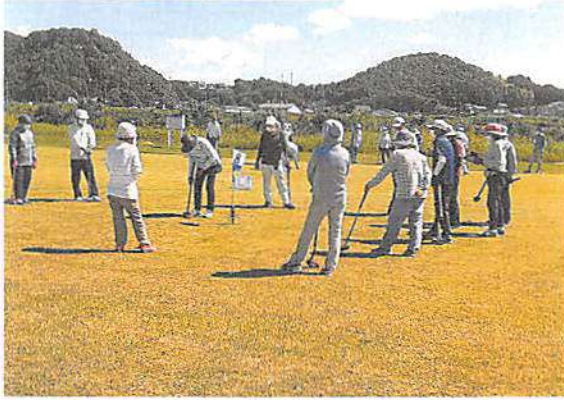
市老連大会出場を目指し熱戦