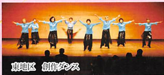
東地区 創作ダンス