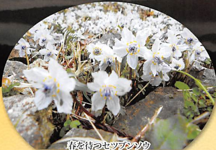
春を待つセツブシソウ