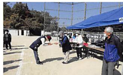
井上委員長から表彰

※第4位と第5位は、同成績でジャンケンで順位決定 ※ホールインワン賞 14名・ラッキー賞 32名