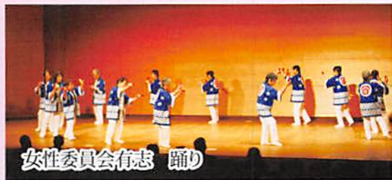
女性委員会有志 踊り