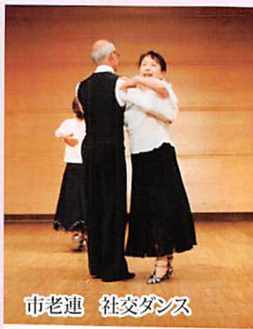
市老連 社交ダンス