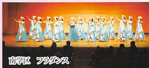
南学区 フラダンス