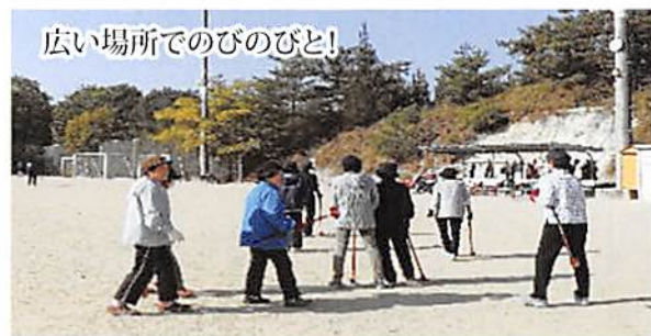
広い場所でのびのびと!