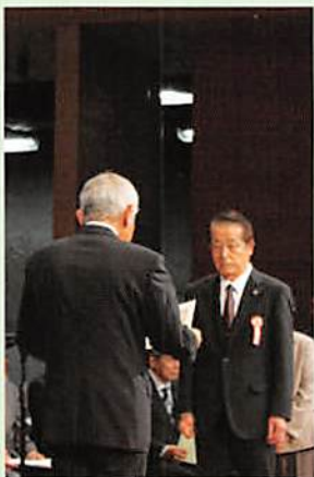
代表者へ表彰状と記念品を贈呈