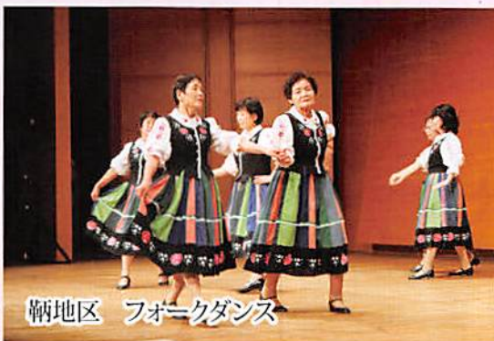
鞆地区 フォークダンス