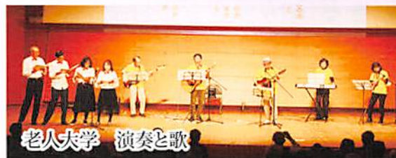
老人大学 演奏と歌