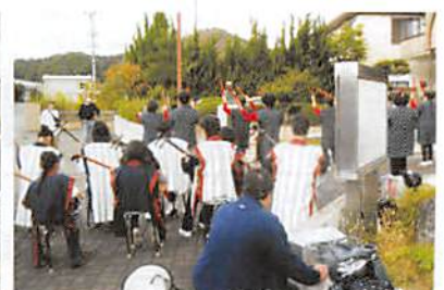
地元の中学生も演奏で参加