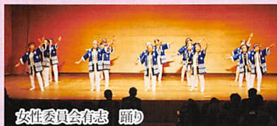
女性委員会有志 踊り