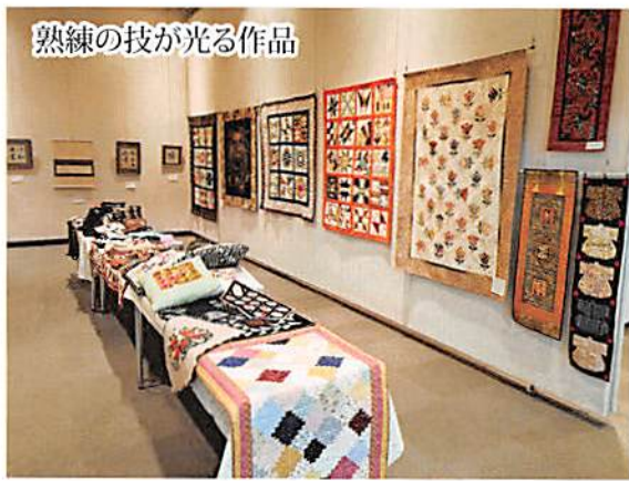
熟練の技が光る作品