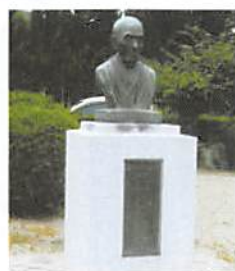
富田久三郎翁胸像

皆さんご存じの「備後緋」を考案し、全国へ広め、備後の産業に大きな影響を残した富田久三郎翁の慰霊と顕彰の催しが、10月21日