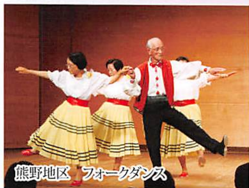
熊野地区 フォークダンス