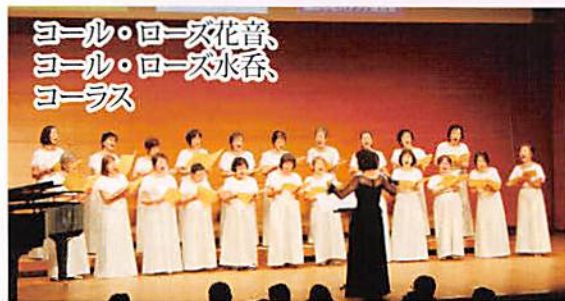
ヨール・ローズ花音、 ヨール・ローズ水音、 ヨールラス

昨年引き続き、リーダーローズ小ホールにおいて、数えて47回となる「芸能祭」を開催しました。今年は、前段の福祉大会を切り離し、単独での芸能祭とし、午後1時半から、まさに芸能尽くしの時間となりました。20組の出演者の中には、老人大学の学生サークルやそのメンバーからの声掛けによる学区サークルのフラダンスなど、盛りだくさんの内容で、初